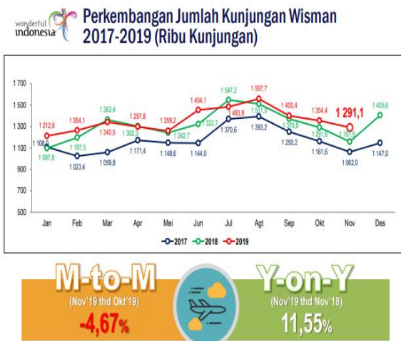
Gambar 1 Perkembangan Jumlah Kunjungan Wisman ke Indonesia 2017-2019

(sumber: Badan Pusat Statistik dirilis per 1 April 2019, diakses pada tanggal 12 Maret 2020)