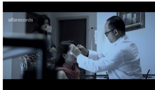
Virzha, Aku Lelakimu

Pada saat tiga orang berada dalam satu ruangan.