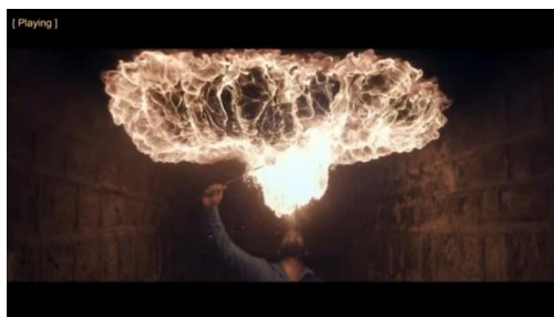
Coldplay, Hymn For The Weekend

Menurut saya pada saat seseorang menyemburkan api, dan teknik pengambilannya juga tepat, serta hasilnya juga bagus.