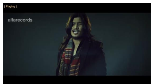
Virzha, Aku Lelakimu