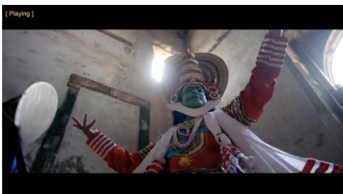
Coldplay, Hymn For The Weekend