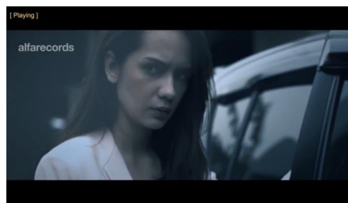
Virzha, Aku Lelakimu

Pada saat si wanita membuka pintu mobil.