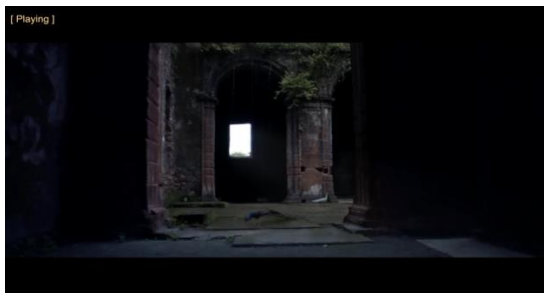
Coldplay, Hymn For The Weekend

Pada gambar dibawah ini menunjukan keseluruhan pemandangan atau suatu tempat dan objek, yaitu seekor merak, untuk memberikan orientasi tempat dimana peristiwa atau tempat adegan itu terjadi dengan teknik Establish shot. Sudut pengambilan kamera menggunakan normal angle dimana posisi kamera sejajar dengan ketinggian mata obyek yang diambil.