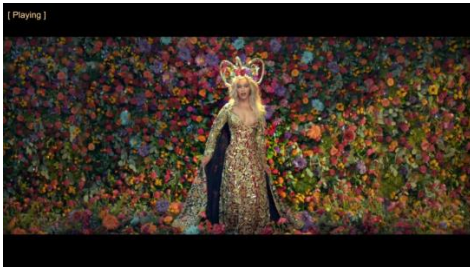
Coldplay, Hymn For The Weekend

Pada gambar dibawah ini, penggunaan teknik pengambilan gambar total shot, untuk menampilkan keseluruhan obyek, menerapkan angle yaitu normal angle, dimana posisi kamera sejajar dengan ketinggian mata obyek yang diambil. Jadi keseluruhan latar maupun objek terlihat jelas.