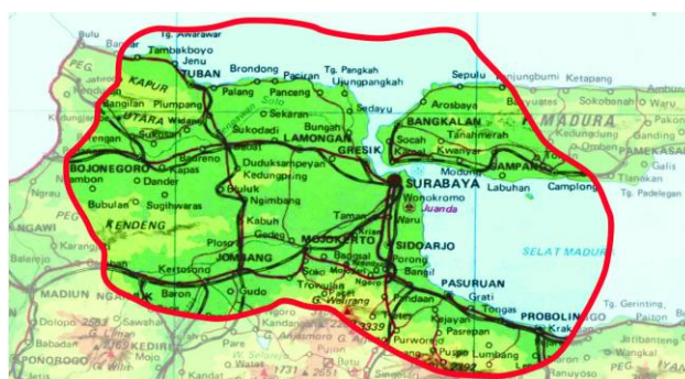
Coverage Area TV 9 ( http://tv9.co.id )

Bersiaran di frekuensi 42 UHF, coverage area siaran TV 9 meliputi beberapa wilayah, antara lain mencakup: Surabaya, Gresik, Lamongan, Sidoarjo, Jombang, Mojokerto, Pasuruan, Probolinggo, dan Bangkalan. Selain itu, siaran TV 9 dipancarkan melalui satelit Telkom 1 dengan frekuensi 3552, simbolrate 3100 dan polarisasi horizontal.