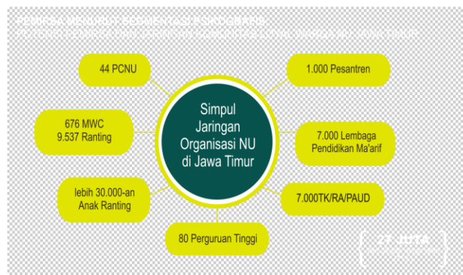
Potensi Komunitas TV 9 ( http://tv9.co.id )

Dari bidang teknik, standard peralatan yang dimiliki TV 9 boleh dikatakan sudah memenuhi standard braodcast . Untuk keperluan siaran di dalam studio, terdapat lima kamera (empat kamera merk Sony , tipe DSRD 35 , dan satu kamera Sony NX5 ). Untuk siaran luar ( out door ), TV 9 memiliki delapan kamera (dua kamera merk Sony , tipe NX5 dan enam kamera Sony tipe MC1500 ).