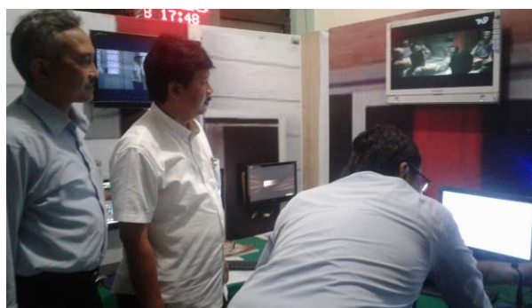
Master Control TV 9

Sementara untuk menunjang bagian teknik, program, dan marketing , pengelola TV 9 juga menempatkan seorang manajer HRD ( Human Resources Development ). Dari perspektif manajemen penyiaran, bagian ini merupakan pilar keempat dan merupakan implementasi dari bagian administrasi. Meski perannya lebih banyak mengatur dan mengelola sumber daya manusia (SDM), namun bagian administrasi ini memegang peranan yang cukup penting. Apalagi di dalamnya juga mengembang fungsi sebagai pengelola anggaran, serta kerjasama dengan pihak luar.