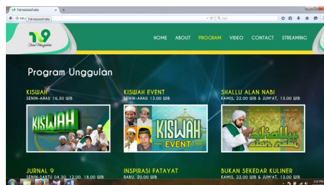
Program Unggulan TV 9 ( http://tv9.co.id )

Saat ini sudah ada pembicaraan dengan investor dari Singapura yang akan memasang aplikasi dengan nama NUtizen ( NU Internet Citizen ). Nantinya aplikasi ini dapat digunakan untuk melihat tayangan-tayangan TV 9 yang memiliki konten agama.