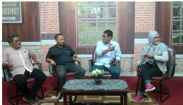
Studio TV 9

Untuk mendukung bagian program, TV 9 juga memiliki tenaga marketing atau pemasaran. Mereka memang diberikan target untuk terus meningkatkan pemasukan dari sektor iklan. Apalagi dalam satu tahun terakhir, klien-klien yang akan memasang iklan di TV 9 jumlahnya semakin bertambah. Seperti misalnya klien dari perusahaan umroh dan produk kain sarung. "Tahun 2017 ini kami sudah sampaikan kepada bagian marketing TV 9 agar lembaga siaran TV 9 harus sudah untung. Bukan lagi BEP ( Break Event Point , red)," ujar Dirut TV 9 dengan mantap (hasil wawancara dengan peneliti, 8 Maret 2017).