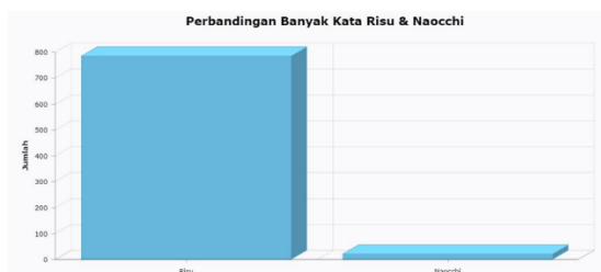
Gambar hasil perbandingan jumlah kata Risu (786) dan Naocchi (21)

Naocchi sendiri disebut dalam livechat Comifuro Virtual 1 2021 Day 1 yang berlangsung selama 7 jam 59 menit lamanya ini dengan jumlah yang sedikit. Kehadiran Virtual Youtuber Ayunda Risu mampu mendisrupsi fandom Penggemar Budaya Jepang dalam mendominasi dirinya dalam livechat tersebut.