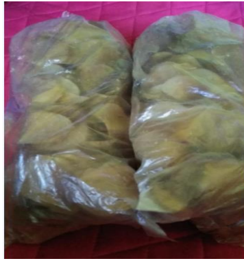
Gambar 13 : Kerupuk Pepaya