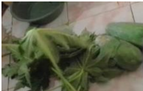
Gambar 1 : Daun Kates

Adapun manfaat daun pepaya bisa Mengobati Demam Berdarah, menyeimbangkan gula darah, Meningkatkan fungsi pencernaan, meningkatkan efek anti inflamasi, menyuburkan rambut (Kompas, 2021)