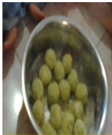
Gambar 6 : Adonan siap giling