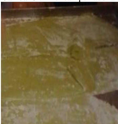
Gambar 7 : Mie sudah digiling menjadi lembaran