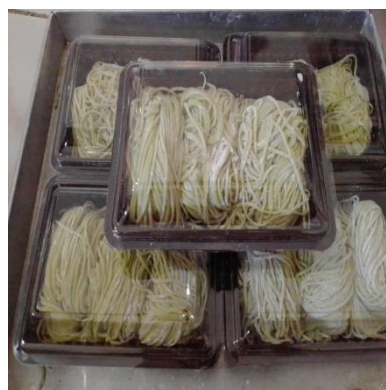
Gambar 8 : Mie Daun Pepaya