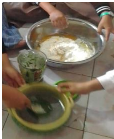
Gambar 5 : Mencampur adonan