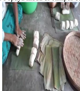
Fambar 12 : Adonan gulung Diiris