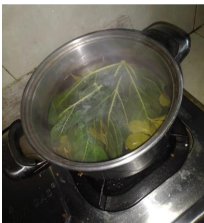
Gambar 3 : Daun pepaya di rebus

Dampak dari pelatihan ini adalah yang tadinya daun pepaya dan buah pepaya banyak yang tidak laku bisa dimanfaatkan untuk mie daun pepaya dan krupuk pepaya. Sehingga menjadi jalan keluar dari persoalan mitra. Dengan adanya inovasi daun pepaya menjadi mie daun pepaya dan pepaya menjadi krupuk pepaya dapat meningkatkan pendapatan anggota mitra.