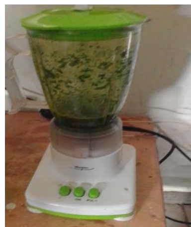
Gambar 4 : Daun pepaya di blender