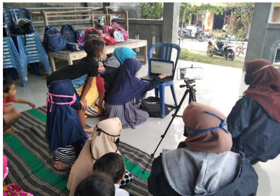
Gambar 3. Tahap Pembelajaran dan Pelatihan