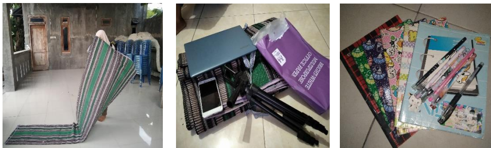
Gambar 2. Tahap Persiapan