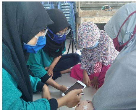
Gambar 4. Tahap Pendampingan Proses Pembelajaran melalui media Hand Phone