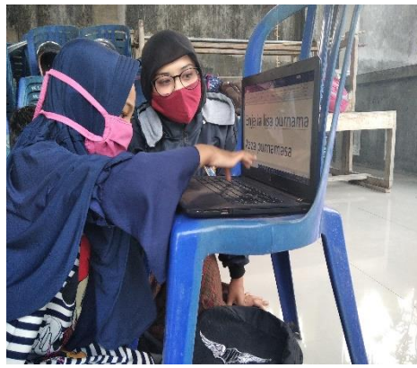
Gambar 5. Tahap Pendampingan Proses Pembelajaran Melalui Media Laptop