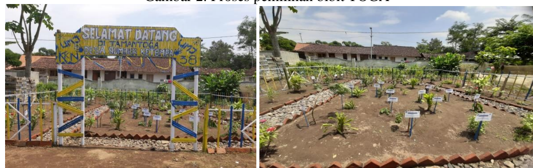
Gambar 3. Taman TOGA Sumberketempa

Percontohan taman TOGA ini memiliki 30 macam tanaman obat, yang mana setiap tanaman dilengkapi dengan papan informasi berisi nama tanaman, nama latin serta manfaatnya. Berikut adalah beberapa papan informasi di setiap tanaman