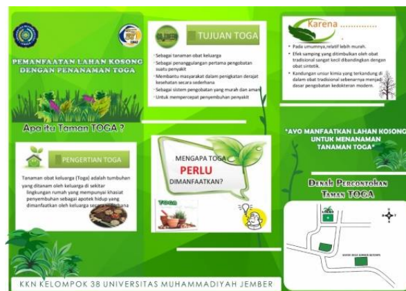
Gambar 6. Leafleat

Setelah peresmian taman TOGA, maka dilakukan penyuluhan dan pembagian brosur kepada perwakilan warga desa Sumberketempa tentang pemanfaatan lahan kosong dengan membuat taman TOGA. Leafleat yang diberikan berisi materi tentang pemanfaatan lahan kosong dengan penanaman TOGA, manfaat TOGA, serta denah letak percontohan taman TOGA ini.