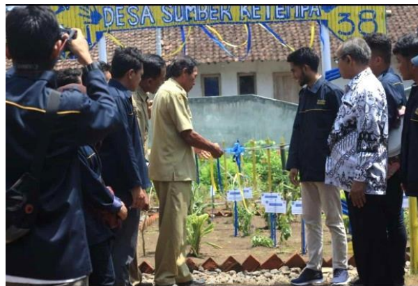
Gambar 5. Peresmian Taman Toga Sumberketempa

Setelah percontohan taman TOGA ini diresmikan oleh kepala desa pada tanggal 25 Februari 2020, taman ini dibuka untuk umum sehingga masyarakat Desa Sumberketempa dapat datang dan berkunjung untuk melihatnya. Setelah masyarakat Desa Sumberketempa melihat percontohan taman TOGA tersebut, masyarakat Sumberketempa menjadi memiliki pengetahuan dan termotivasi untuk memanfaatkan lahan kosong miliknya sebagai taman TOGA.