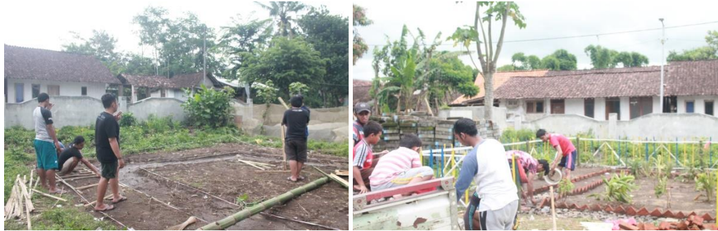
Gambar 1. Proses pembuatan taman TOGA

serta pemasangan papan informasi disetiap tanaman dilakukan pada tanggal 14 s/d 23 Februari 2020.