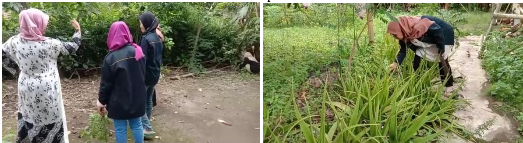
Gambar 2. Proses pemilihan bibit TOGA