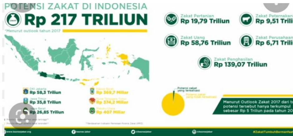
Gambar 1: Potensi Zakat di Indonesia Pada Tahun 2017

Potensi ini juga sejalan dengan pertumbuhan penghimpunan zakat yang terus mengalami kenaikan dari tahun ketahun. Penghimpunan dana zakat mengalami kenaikan sebesar 37,34% di tahun 2016 dan naik kembali sebesar 24,06% di tahun 2017 (Baznas, 2019). Kenaikan tersebut dikarenakan naiknya jumlah muzaki (orang yang berzakat), munfiq (orang yang berinfaq) dan donatur lainnya.