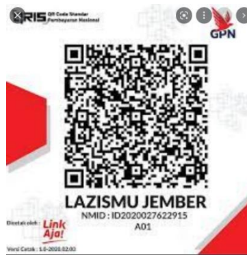
Gambar 3: Barcode QRIS LAZISMU Jember

QRIS yang dibentuk LazisMu Jember pada dasarnya merupakan satu langkah maju dalam meningkatkan penghimpunan zakat. Hadirnya QRIS tentu harus disertai dengan gencarnya kegiatan sosialisasi kepada calon muzaki , dan munfiq yang menjadi sasaran. Hal ini sesuai dengan pendapat Philip dan Williams (2018) yang mengemukakan bahwa pemanfaatan dan penyebaran teknologi harus disertai dengan kegiatan promosi digital. Hal ini bertujuan untuk mengatasi kesenjangan dan gap digital yang ada di masyarakat.