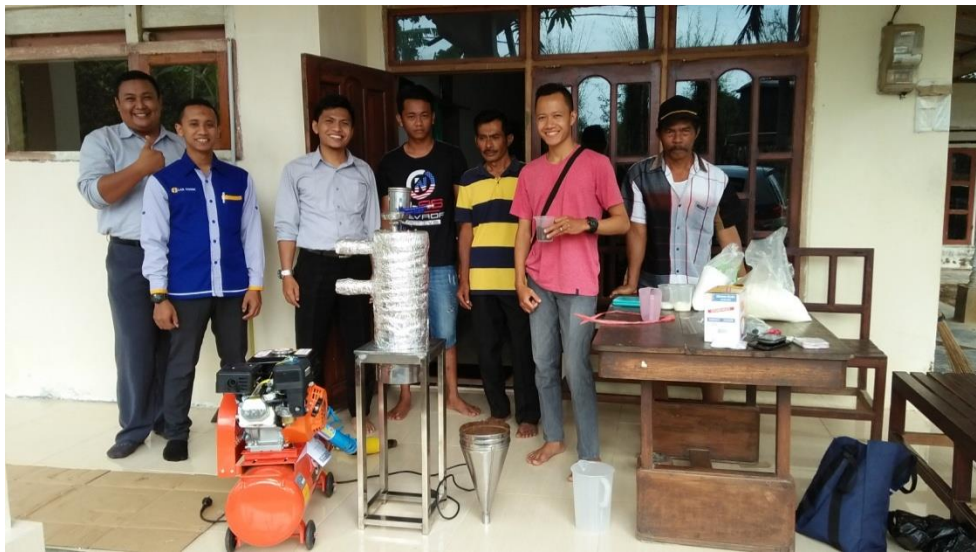
Gambar 3. Pelatihan Praktek Produksi Bubuk Kopi Instan

pembelian beberapa peralatan tambahan untuk kebutuhan mitra seperti mesin kompressor dan selang yang akan menghubungkan mesin kompressor ke mesin spray dryer. Pengiriman unit mesin spray dryer dan peralatan tambahan ke mitra Kelompok Tani Kopi Raung Desa Silo Kecamatan Silo Kabupaten Jember. Lokasi pelatihan dan pendampingan proses produksi di Kelompok Tani Kopi Raung sebagai pengelola unit produksi. Kegiatan utamanya adalah praktek produksi bubuk kopi instan yang melibatkan para pengurus dan anggota dari kedua mitra ditunjukkan dalam Gambar 3, dan pendampingan pengujian terhadap mutu dan hasil produk bubuk kopi instan dalam kemasan ditunjukkan dalam Gambar 4. Pengujian organoleptik meliputi tekstur, aroma dan rasa dari kopi instan untuk memastikan produk telah sesuai standar mutu. Hasil kegiatan berupa produk bubuk kopi instan yang telah sesuai standar, siap dikemas dan dipasarkan.