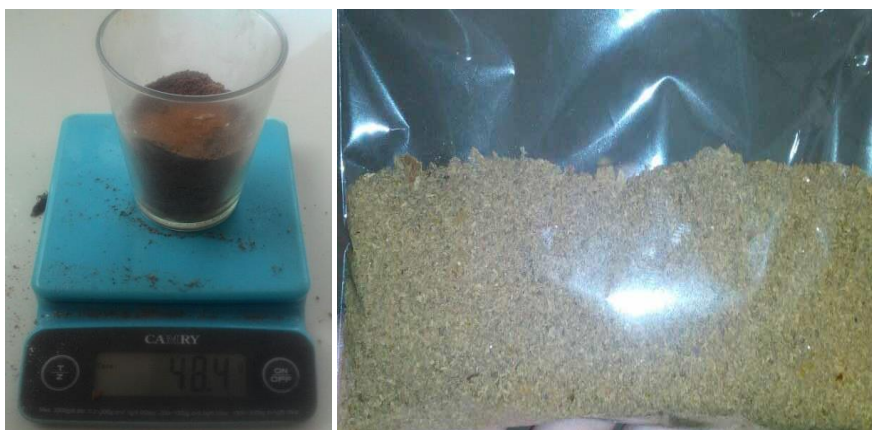
Gambar 2. Butiran Bubuk Kopi Instan

Berdasarkan komposisi bahan seperti pada Tabel 4 dilakukan dua pengujian. Pengujian pertama menggunakan larutan kopi instan sebanyak 550 ml pada mesin spray dryersigle heater soft gun . Dengan 170 ml pada tangki bahan dihasilkan maksimal bubuk kopi instan sebanyak 6 gram atau 3,5% ditunjukkan dalam Gambar 11. Prosentase hasil bubuk kopi instan relatif kecil dan tidak mencerminkan kebutuhan mitra dan nilai keekonomian sehingga tidak kompetitif. Pengujian kedua menggunakan larutan kopi instan sebanyak 350 ml (pengurangan 200 ml air dari pengujian sebelumnya) sehingga larutan kopi instan lebih kental. Dengan 170 ml pada tangki bahan dihasilkan maksimal butiran bubuk kopi instan sebanyak 48,5 gram atau 28,5% (48,5 gr dari 170 ml) dalam alat timbangan dan kemasan plastik ditunjukkan dalam Gambar 2. Prosentase bubuk kopi instan yang dihasilkan menjadi jauh lebih tinggi dengan peningkatan sebesar 25%.