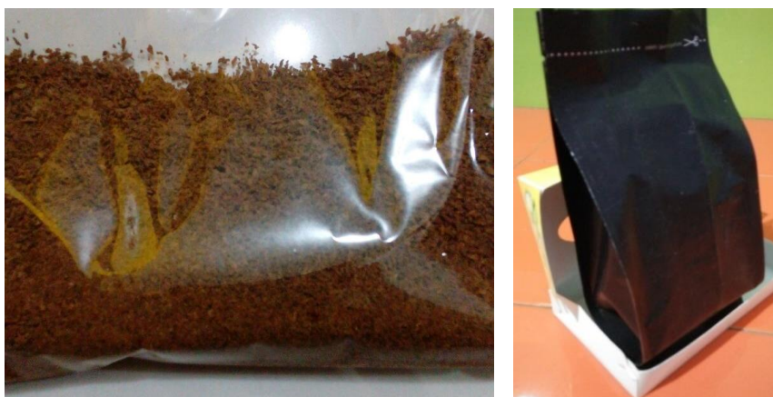
Gambar 4. Produk Bubuk Kopi Instan Dalam Kemasan