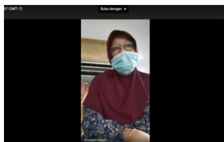
Gambar 3. Foto Kegiatan Pengabdian

Modul kegiatan pembelajaran terdiri atas 20 bab. Kedua puluh bab tersebut merupakan contoh pemanfaatan barang bekas sebagai alat permainan edukatif anak guru di Pendidikan Anak Usia Dini. Semua contoh ditulis dalam bab-bab sesuai dengan bahan-bahan yang bisa dimanfaatkan. Kelebihan dari modul ini adalah penjelasan manfaat penggunaan alat permainan edukatif dengan cara / pemanfaatan barang bekas 107 Tahun 2013 tentang standar proses pembelajaran pada cabang perkembangan anak. Semua alat permainan edukatif yang dijelaskan disusun dengan sistematis yang bertujuan, sehingga memudahkan pembaca dalam memahami penggunaan dan manfaatnya dalam pembelajaran anak usia dini. Sebagai modul ini bermanfaat untuk peningkatan mutu penyelenggaraan Pendidikan Anak Usia Dini. Guru dapat berkreasi menggunakan aneka bahan-bahan, sehingga pelaksanaan pembelajaran anak usia dini benar-benar didesain menyenangkan dan mengandung unsur edukasi yang tinggi.