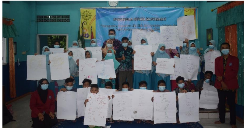
Gambar 6. Rancangan Goal Setting oleh Anak Panti Asuhan

Pada tahap selanjutnya anak-anak Panti Asuhan Aisyiyah Balongbendo diajarkan bagaimana mengubah keyakinan negatif menjadi keyakinan positif serta mengenal dan mengelola emosi. Dan pada akhir tahap, trainer mengajarkan cara membuat goal setting untuk kehidupannya masing-masing. Pada tahap ini mereka tampak bersemangat dalam merancang kehidupannya serta mempresentasikan hasil rancangan masa depannya didepan kelas sebagaimana tampak pada gambar 6.