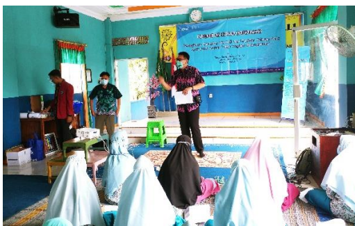
Gambar 2. Pengarahan Awal Sebelum Pelatihan Hari 1

Kegiatan self regulation training dilaksanakan pada tanggal 14 – 15 Desember 2020, selama 1 hari penuh mulai pukul 09.00 – 16.00 WIB. Anak-anak Panti Asuhan Yatim 'Aisyiyah yang terlibat dalam kegiatan ini sebanyak 25 anak asuh. Untuk rentang usia yang diikuti dalam kegiatan self regulation training ini adalah mereka yang sudah berada di jenjang kelas 5-6 SD serta jenjang SMP dan SMA. Pada kegiatan ini diawali dengan sesi perkenalan serta pengisian pre test mengenai kemampuan regulasi diri anak panti asuhan yang terlihat pada gambar 1.