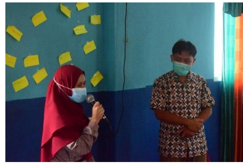
Gambar 5. Presentasi Kelebihan Dirinya