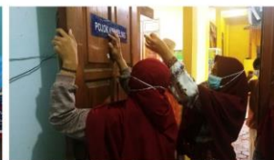
Gambar 13. Proses Pemasangan Plakat Pojok Konseling Oleh Anak Pantu Asuhan