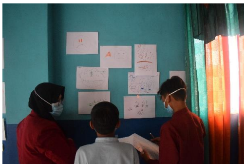
Gambar 4. Praktek Menuliskan Kelebihan

Setelah anak-anak panti selesai mengisi pre test sebagaimana pada gambar 2, kemudian trainer yang terdiri dari 2 orang dengan dibantu oleh asisten trainer secara bergantian memberikan pembekalan mengenai tahapan-tahapan regulasi diri. Dimana pada tahap pertama mereka dikenalkan mengenai pemahaman akan potensi diri untuk membangun konsep diri positif. Pada tahap ini hasil yang didapatkan adalah bahwa konsep diri positif dalam diri mereka tumbuh kembali, yang sebelumnya tidak mau berbicara didepan rekan-rekannya mengenai kelebihan mereka, setelah kegiatan ini mereka berani untuk mengemukakan kelebihan yang mereka miliki serta menuliskannya di sebuah kertas untuk ditempel di dinding sebagaimana tampak pada gambar 4 dan gambar 5. Dalam penyampaiannya, pengabdian menggunakan berbagai model pembelajaran seperti bermain kartu, praktek serta diskusi sehingga tidak monoton dan membuat mereka sangat antusias. Hal ini dilakukan sebab model pembelajaran yang bervariasi, seperti menggunakan Flipbook-Based Electronic Textbooks dalam belajar akan membuat siswa termotivasi untuk belajar (Ratnasari & Hasanah, 2020).