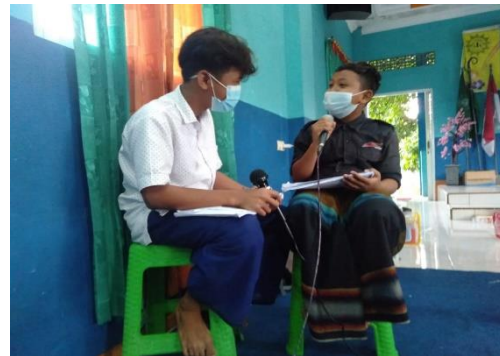
Gambar 22. Praktek Menjadi Konselor Sebaya Kelompok Putra

Pada sesi akhir sebelum penutupan, mereka diminta untuk membuat kelompok konselor serta membuat pojok konseling yang dipandu oleh Tim Abdimas Umsida dan Pengasuh. Adapun proses pembuatan pojok konseling hasil kreasi dari anak asuh tampak sebagaimana yang terlihat pada gambar 13, gambar 14 dan gambar 15.