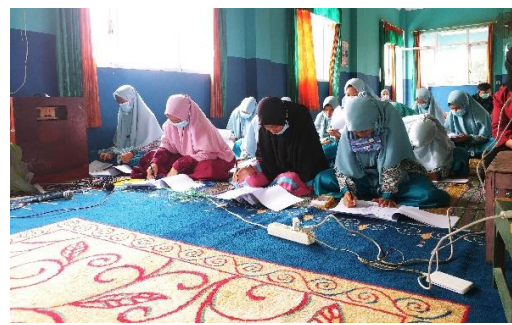
Gambar 3. Tahap Pre Test

Setelah anak-anak panti selesai mengisi pre test sebagaimana pada gambar 2, kemudian trainer yang terdiri dari 2 orang dengan dibantu oleh asisten trainer secara bergantian memberikan pembekalan mengenai tahapan-tahapan regulasi diri. Dimana pada tahap pertama mereka dikenalkan mengenai pemahaman akan potensi diri untuk membangun konsep diri positif. Pada tahap ini hasil yang didapatkan adalah bahwa konsep diri positif dalam diri mereka tumbuh kembali, yang sebelumnya tidak mau berbicara didepan rekan-rekannya mengenai kelebihan mereka, setelah kegiatan ini mereka berani untuk mengemukakan kelebihan yang mereka miliki serta menuliskannya di sebuah kertas untuk ditempel di dinding sebagaimana tampak pada gambar 4 dan gambar 5. Dalam penyampaiannya, pengabdian menggunakan berbagai model pembelajaran seperti bermain kartu, praktek serta diskusi sehingga tidak monoton dan membuat mereka sangat antusias. Hal ini dilakukan sebab model pembelajaran yang bervariasi, seperti menggunakan Flipbook-Based Electronic Textbooks dalam belajar akan membuat siswa termotivasi untuk belajar (Ratnasari & Hasanah, 2020).