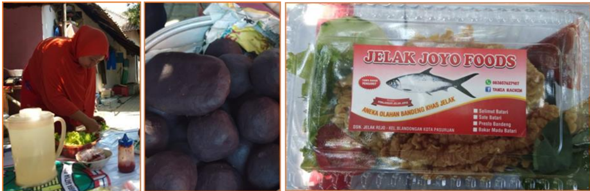
Gambar 1. Gambaran Awal Produk Jelak Juyo Foods

Jelak Juyo Foods merupakan kelompok usaha olahan pangan yang beranggotakan ibu-ibu rumah tangga yang tinggal di Dusun Jelak, Kelurahan Blandongan. Awalnya beberapa perwakilan ibu-ibu diberikan pelatihan tentang pengolahan ikan utamanya bandeng yang menjadi komoditas utama pada Dusun tersebut. Dengan pengembangan kreatifitas yang dilakukan oleh anggota Jelak Juyo Foods. Saat ini Jelak Juyo Foods mampu memproduksi berbagai olahan bandeng yang memiliki ciri khas atau karakteristik unik bila dibandingkan dengan produk olahan bandeng pada umumnya. Salah satu produk keunggulan mereka adalah “BATARI” atau singkatan dari “Bandeng Tanpa Duri”. Produk olahan bandeng ini dimasak kembali menjadi produk Batari Bakar madu dan Batari Krispi. Tidak hanya itu, Jelak Juyo Foods ini terus mengembangkan produknya menjadi berbagai olahan inovatif seperti, otak-otak bandeng, bandeng tulang lunak, atau bandeng presto, pepes tulang bandeng, terasi udang dan rengginang yang berpotensi menjadi produk-produk khas Kota Pasuruan.