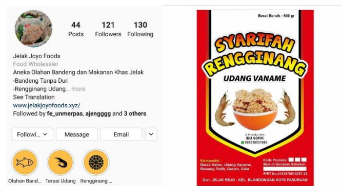
Gambar 4. Akun Sosial Media dan Salah Satu Label Kemasan Produk Terbaru

Pengelolaan manajemen pemasaran merupakan solusi utama dari permasalahan yang dihadapi oleh kelompok usaha Jelak Joyo Foods. Pemateri menyampaikan bahwa kualitas produk yang baik tanpa disertai dengan packaging dan pemasaran yang baik maka hasil yang didapatkan oleh pelaku usaha tidak akan maksimal. Pengemasan produk tidak hanya bertujuan untuk menjaga kualitas produk agar tetap bagus akan tetapi juga bisa meningkatkan nilai dari produk tersebut. Produk dengan kemasan yang menarik dan disertai dengan berbagai informasi yang mendukung seperti pemberian merek, pencantuman bahan baku yang digunakan, tanggal expired, alamat, contact person, social media serta P-IRT lebih diminati oleh masyarakat dibanding dengan produk dengan kemasan yang sederhana. Hal ini disebabkan oleh persepsi konsumen yang menganggap produk dengan kemasan yang baik berpengaruh terhadap kualitas dan kepercayaan konsumen pada produk tersebut. Pemateri juga menyampaikan bahwa strategi pemasaran saat ini sudah beralih dari konvensional menjadi serba digital. Pemanfaatan gadget dan social media dalam pengkomunikasian produk sangat disarankan sebab social media sudah menjadi bagian dari hidup masyarakat sehari-hari sehingga dianggap efisien dalam strategi pemasaran. Team pengabdian masyarakat membantu kelompok Jelak Joyo Foods untuk memasarkan produknya di social media antara lain Facebook, Whatsapp, dan Instagram.