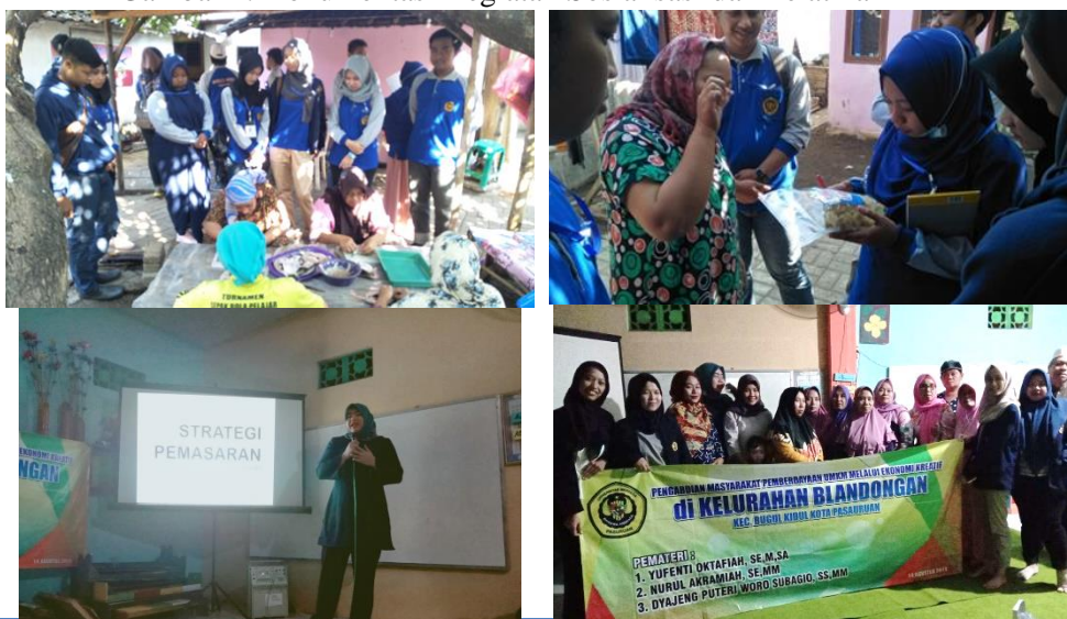
Gambar 2. Dokumentasi Kegiatan Sosialisasi dan Pelatihan

Materi sosialisasi pertama yaitu tentang penumbuhan jiwa kewirausahaan dan pengelolaan manajemen yang baik. Pemateri menyampaikan bahwa potensi hasil laut yang dimiliki Dusun Jelak mampu meningkatkan perekonomian masyarakat apabila diolah dan dikembangkan dengan baik. Ibu ibu rumah tangga merupakan kelompok yang berpotensi untuk diberdayakan dalam kegiatan usaha, khususnya bagi mereka yang belum memiliki pekerjaan diluar rumah. Pengelolaan hasil laut seperti bandeng dan udang menjadi berbagai macam olahan makanan serta terasi akan meningkatkan nilai ekonomis dari produk itu sendiri. Keinginan berwirausaha yang tinggi akan meningkatkan kreativitas, pola pikir serta daya saing yang lebih tinggi bagi ibu-ibu rumah tangga sehingga mampu menghasilkan produk unggulan.