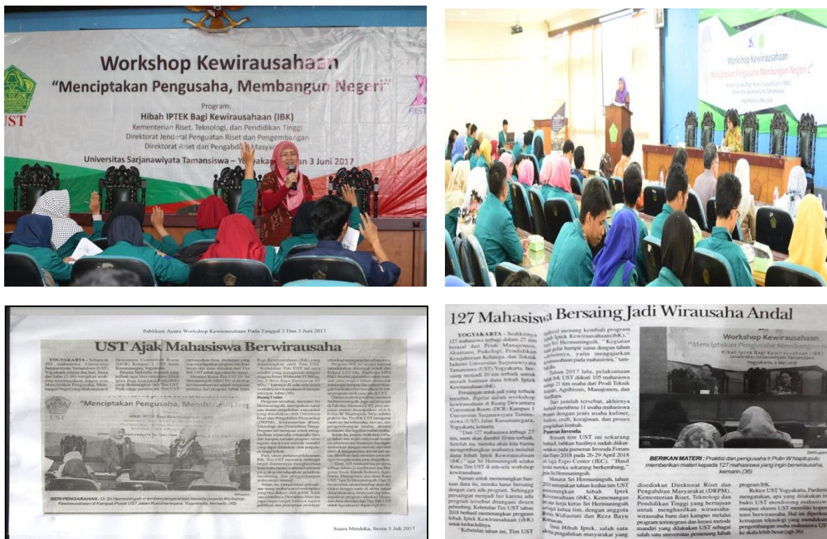
Gambar 1. Dokumentasi Workshop Kewirausahaan #1 dan #2 serta publikasi pada media massa

Pelaksanaan Workshop Kewirausahaan #2 melibatkan 128 peserta mahasiswa yang berasal dari program studi Manajemen, Akuntansi, Psikologi, Pendidikan Kesejahteraan Keluarga, Teknik Industri yang terbagi ke dalam 27 kelompok usaha. Pelaksanaan Workshop Kewirausahaan #2 ini difokuskan kepada usaha dengan kategori kerajinan (9 kelompok) dan kuliner (18 kelompok) berdasarkan hasil penelitian selera profil usaha ( business profile appetite ) pelaksanaan PPK pada tahun sebelumnya. Pada pelaksanaan Workshop Kewirausahaan #2 ini telah dipilih 10 tenant potensial dan akan mendapatkan pembinaan intensif dari tim PPK UST.