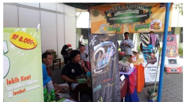
Gambar 3. Dokumentasi Bazar Produk PPK 2018 UST di “Job Fair Exhibition Disnakertrans DIY & UST”