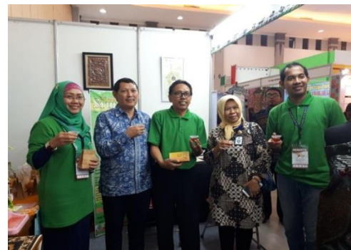
Gambar 2. Dokumentasi Stand INVESDA Forum 2018 dari Tim PPK UST