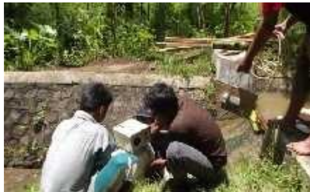
Gambar. 2 Pemasangan Alternator