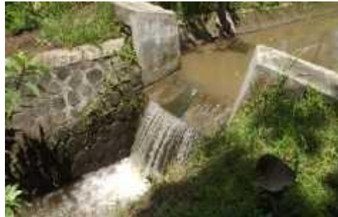
Gambar. 1 Sungai Yang Di Gunakan

batasan penggunaan berkisar antara 100 - 250 Watt. Berikut adalah sungai yang digunakan PLTM Gambar 1