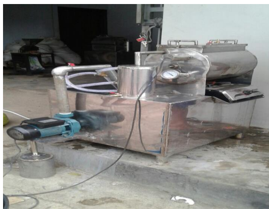
Gambar 1. Mesin Vacuum Frying Kapasitas 2 Kg Bahan