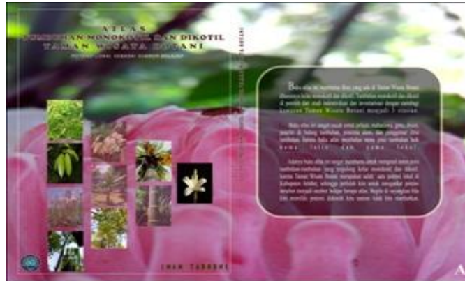
Gambar 1. kulit depan atlas, kulit belakang atlas, dan punggung atlas