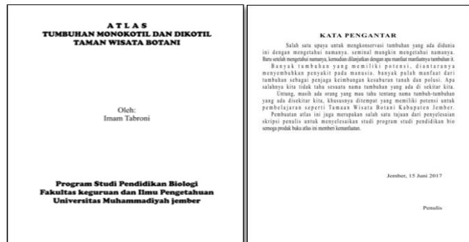
Gambar 2. Bagian halaman judul dan halaman kata pengantar