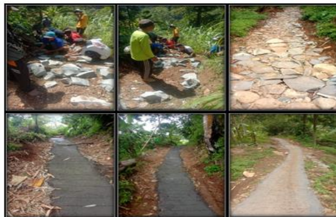
Gambar 3. Dokumen Kegiatan Kerja Bakti Pembuatan Makadam dan Pengecoran Jalan Selatan

Adapun untuk kegiatan pemasangan jalan batu (makadam) jalan selatan sebagai tempat utama untuk pengecoran jalan, dilaksanakan selama 8 hari, setiap hari minggu. Lima hari untuk proses penataan batu pada jalan, dan 3 hari untuk proses pengecoran jalan yang sudah berbentuk makadam. Berikut dokumen kegiatan untuk jalan selatan.