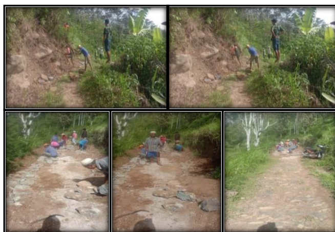
Gambar 2. Dokumentasi Kegiatan Kerja Bakti Pemasangan Jalan Batu (Makadam) Jalan Utara

Adapun tahapan pelaksanaan kegiatan, yaitu pembuatan makadam jalan utara dan selatan, disepakati akan dilakukan dalam dua hari dengan cara kerja bakti dan gotong royong. Setiap pekan, pada hari Sabtu, kerja bakti di fokuskan pada area jalan utara, sedangkan hari minggu pada area jalan selatan, seperti yang tampak pada foto kegiatan berikut.