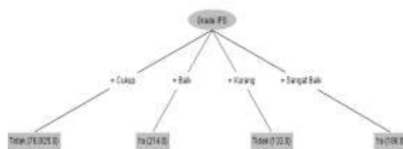
Gambar 3. Hasil Pohon Keputusan

Gambar 3 adalah pohon keputusan ( tree ) yang terbentuk dari proses klasifikasi prediksi kelulusan mahasiswa menggunakan algoritma C4.5 . Pada pohon