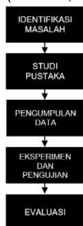
Gambar 1. Metode Penelitian

Tahapan-Tahapan metode yang dilakukan pada penelitian ini adalah sebagai berikut (Rahman, M. 2019):