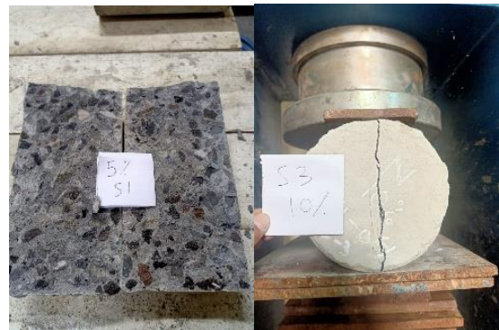
Gambar 3. Pola Retak Pengujian Kuat Tarik

Pada pengujian kuat tarik belah silinder beton ditemui bentuk retak pada benda uji terlihat berikut ini