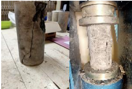
Gambar 2. Pola Retak Pada Kuat Tekan

Pola rekah pada pengujian kuat tekan silinder beton seperti berikut pada Gambar 2