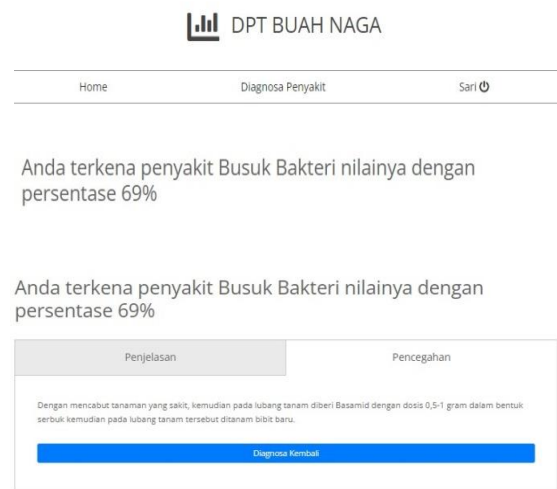
Gambar 3. Hasil Diagnosa

Halaman hasil konsultasi digunakan oleh user yang berfungsi melihat hasil diagnosa berdasarkan konsultasi sebelumnya. Pada halaman hasil konsultasi ditampilkan berupa penyakit yang mungkin diderita oleh user beserta persentasenya. Hasil diagnosa menampilkan penyakit yang mungkin diderita dan solusi pencegahan hama maupun penyakit yang sedang diderita.