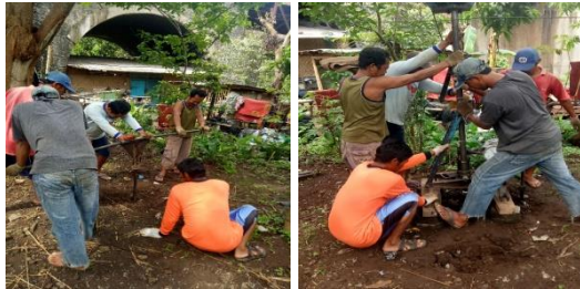
Gambar 4. Dilapangan saat sondir mencari data