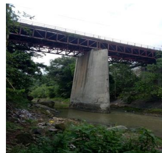
Gambar 3. pier jembatan

Survei ini maksudkan untuk mendapatkan gambaran tentang jembatan existing serta bagian-bagian jembatan yang diadakan penelitian terkait rencana pelebaran.