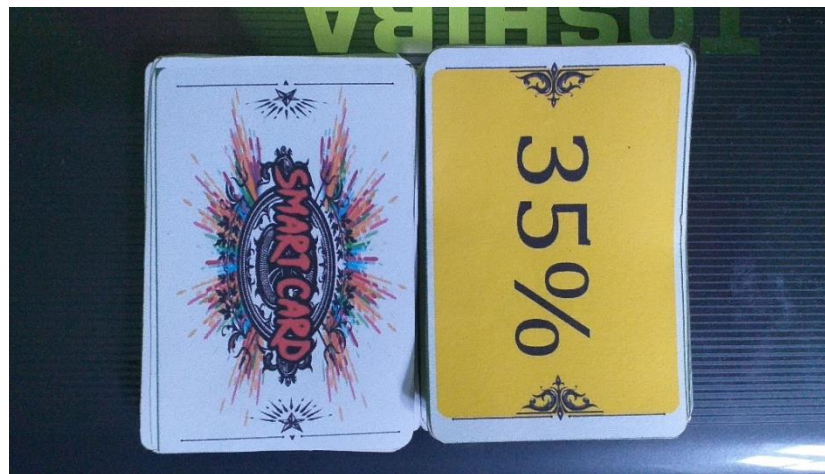
GAMBAR 3 Kartu Smart Card yang Telah Di Potong

Untuk membuat pembelajaran yang interaktif, inspiratif, menyenangkan, menantang, memotivasi Siswa Smart card di sesuaikan dengan materi dan kebutuhan sekolah. Media ini tidak memerlukan listrik ataupun alat elektronik yang serba canggih. Jadi media ini dapat digunakan oleh sekolah yang minim dalam hal teknologi seperti di SMPI Zainal Abidin. Media belajar berupa Smartcard ini belum terlalu di kenal di sekolah-sekolah, terlebih di sekolah yang ada di lingkungan Kecamatan Sumberasih. Revisi dan potensi Samart Card untuk dikembangkan sangat tinggi. Serta penggunaannya tidak terbatas pada materi perbandingan pecahan senilai saja tetapi dapat diterapkan pada materi lainnya.