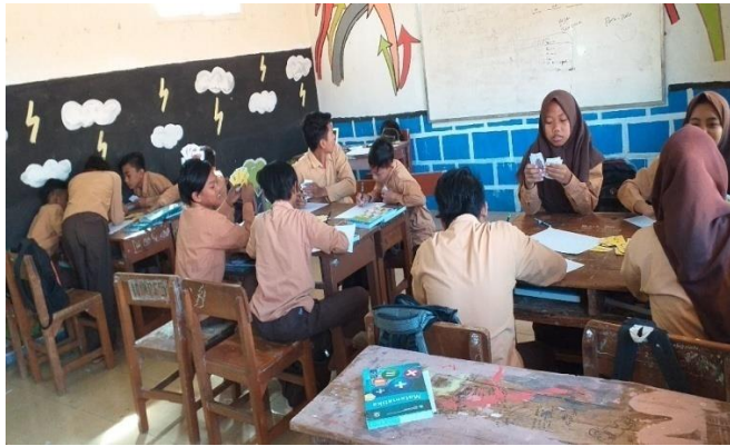
GAMBAR 4 Penerapan Smart Card dalam Materi Pecahan Senilai

Permainan Smart Card ini penggunaannya sangatlah mudah, dan cara membuatnya juga mudah, apalagi bahannya terbuat dari kertas buffalo yang harganya relative terjangkau.