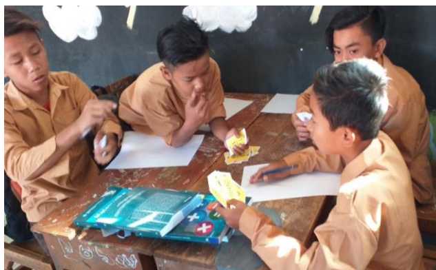
GAMBAR 2 Aplikasi Smart Card

Cara penggunaan Smart Card ini yaitu: 1) Bentuk kelompok pemain yang terdiri dari 4 orang, 2) Kartu di kocok dan kemudian dibagikan kesetiap pemain, 3) Pemain yang mendapat giliran mengocok kartu mempunyai kesempatan untuk menaruh kartu pertama terlebih dahulu, dan 4) Pemain yang lain mencocokkan dengan kartu yang sudah di keluarkan oleh pemain lain, apabila kartu yang dikeluarkan senilai dengan kartu yang ada di tangan maka pemain tersebut mengeluarkan kartu yang senilai dengan yang ada di tangan serta pemain tersebut mengeluarkan kartu sembarang dari tangan, dan 5) kemudian dilanjutkan sampai salah kartu smart card habis.