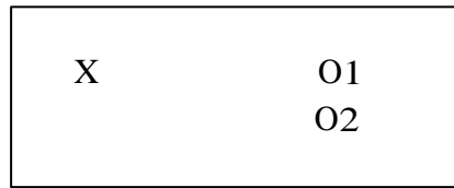
GAMBAR 1 Desain Penelitian

Populasi dalam penelitian ini adalah seluruh siswa kelas VII SMP Negeri 17 Bekasi yang pada semester genap tahun ajaran 2017/2018. Adapun pengambilan sampel ini dilakukan dengan teknik sampling purposive tetapi yang dirandom adalah kelas. Penetapan sampel dilakukan secara acak, kelas yang terpilih dan digunakan untuk penelitian ini adalah kelas VII-5 dan VII-9. Dari dua kelas tersebut terpilih kelas VII-9 sebagai kelas eksperimen yang diberikan model pembelajaran Creative Problem Solving (CPS) dan kelas VII-5 sebagai kelas kontrol yang tidak diberikan model pembelajaran Creative Problem Solving (CPS).