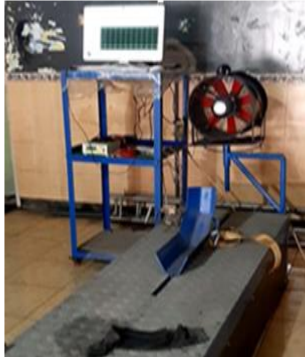
Gambar 1. Dyno test

Persentase campuran 0, 5, 10, dan 15%. Pengambilan data sebanyak 3 kali percobaan pada rpm 400-800 dan gigi 3.