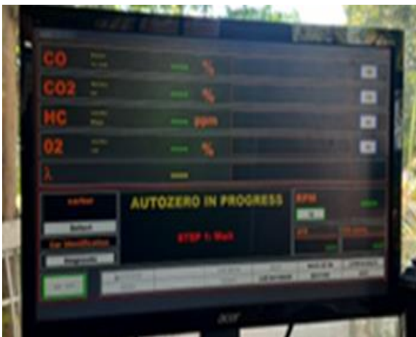
Gambar 4. Komputer analisis