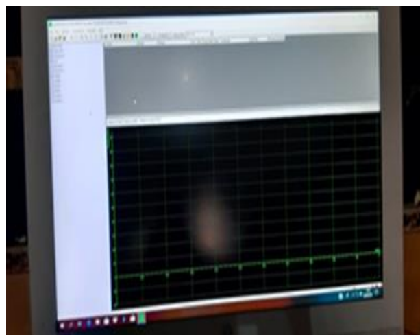
Gambar 2. Komputer

Dynotest seperti yang ditunjukkan pada Gambar 1. merupakan alat yang digunakan untuk mengukur kinerja daya (Hp), torsi (Nm), dan lambda ( \lambda ) pada kendaraan bermotor. Perangkat pendukung mesin dynotest antara lain roller , blower , dan sistem pengaman agar motor tidak goyang saat melakukan pengujian. Hasil dari pengujian ditampilkan dalam layar komputer yang sudah dipasangkan pada perangkat mesin dyanotest [6]. Perangkat komputer yang digunakan ditunjukkan pada Gambar 2.