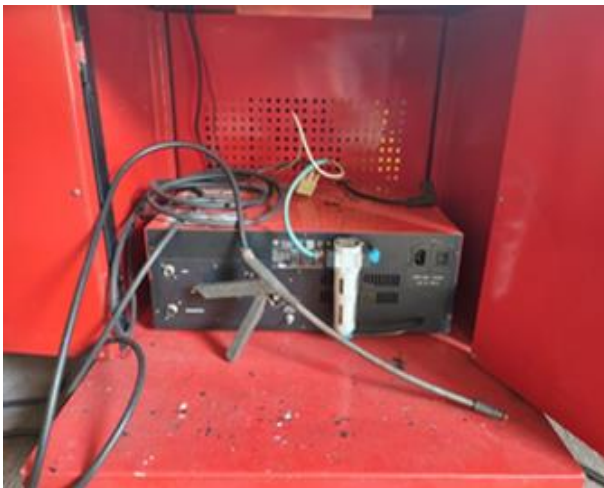
Gambar 3. Gas analyzer

Gas analyzer yang digunakan disajikan pada Gambar 3. Gas analyzer adalah sebuah alat yang digunakan untuk mengukur gas buang pada kendaraan bermotor. Gas Analyzer adalah suatu instrumen yang bermanfaat untuk mengukur proporsi dan komposisi dari gabungan gas. Gas yang biasa diukur oleh perangkat ini ialah gas karbon dioksida (CO 2 ), oksigen (O 2 ), karbon monoksida (CO), hidro karbon (HC), dan lambda ( \lambda ) [7]. Hasilnya ditampilkan pada monitor komputer analisis seperti Gambar 4. Cara kerjanya yaitu mengambil sampel dari probe, kemudian masuk ke masing-masing sampel cell lalu sampel akan dikomparasikan dengan gas standar melalui pemancar sistem sehingga menghasilkan perbedaan panjang gelombang sehingga dapat dikonversi menjadi sinyal analog oleh sinyal receiver.