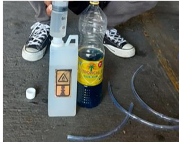
Gambar 5. Bioetanol kadar (99%) dan pertamax (92)

Bioetanol yang digunakan untuk penelitian adalah jenis fuel grade yang tidak berwarna atau bening.