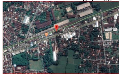
Gambar 1. Lokasi Penelitian Tugas Akhir

Dengan pelayanan yang baik, diharapkan jasa transportasi ini dapat memberikan kelancaran, kenyamanan dan keamanan bagi pengguna jasa.