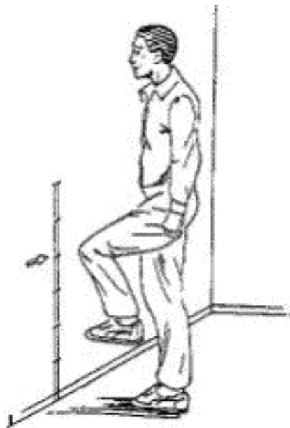
Gambar 1. Kebugaran ( 2minute step test )

Pertemuan ketiga , Tim melakukan screening kebugaran lansia di PRA Aisyiyah Palbapang Barat, Bantul, Yogyakarta. Acara ini dihadiri 40 lansia dengan hasil 32 lansia mengalami gangguan kebugaran yang di ukur dengan 2 minute step test dengan memperhatikan keselamatan lansia.