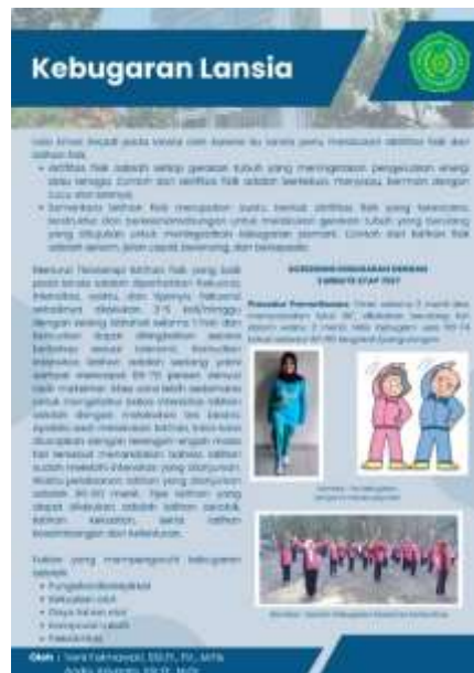
Gambar 3. Poster Kebugaran Lansia

Rekomendasi diharapkan lansia menyadari bahwa usia dan fisik berpengaruh terhadap kebugaran. Melakukan sreaning lengkap ke medis atau puskesmas serta melakukan latihan atau senam secara rutin dengan tujuan menjaga kebugaran.