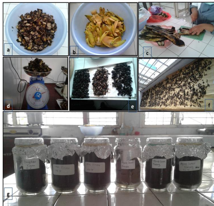
Gambar 1. Tahapan ekstraksi dan pembuatan simplisia kering kulit pisang Agung Semeru dan Mas Kirana

Analisis kandungan fitokimia ekstrak kulit pisang Agung Semeru varietas Lumajang dan ekstrak kulit pisang Mas Kirana varietas Lumajang dilakukan untuk mengetahui kandungan senyawa antimikroba. Senyawa yang dianalisis pada penelitian ini yaitu senyawa flavonoid, senyawa fenolik, senyawa terpen, senyawa saponin dan senyawa alkaloid (tabel 1 dan 2; Gambar 3). Sebelum dilakukan analisis fitokimia, dilakukan proses pembuatan ekstraksi simplisia kering (Gambar 1) dan simplisia basah (Gambar 2) yang dilakukan dengan beberapa tahapan.