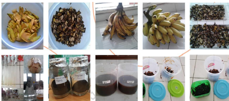
Gambar 2. Tahapan ekstraksi dan pembuatan simplisia basah ekstrak kulit pisang Agung Semeru dan Mas Kirana