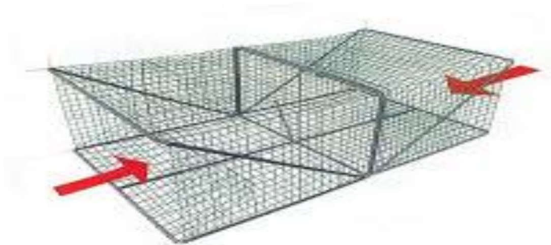
Gambar 8. Bubu Lipat dari Bahan Besi Kawat Galvanis

Prosedur pengambilan sampel kepiting bakau dilakukan melalui tahapan-tahapan sebagai berikut: 1) Pengambilan sampel kepiting bakau dilakukan pada spesimen yang masih hidup dengan menggunakan alat tangkap bubu, 2) Kepiting Bakau ( Scylla spp.) yang diambil, dibersihkan, dilakukan pegikatan dan dimasukkan ke dalam ember plastik, 3) Menghitung jumlah dan jenis individu yang ditemukan, diambil 3 spesimen dari setiap jenis yang ditemukan untuk diidentifikasi kemudian kepiting selebihnya dikembalikan ke habitatnya, 4) Pemberian label pada wadah plastik yang berisi sampel, 5) Mendokumentasikan jenis kepiting bakau yang ditemukan dengan menggunakan