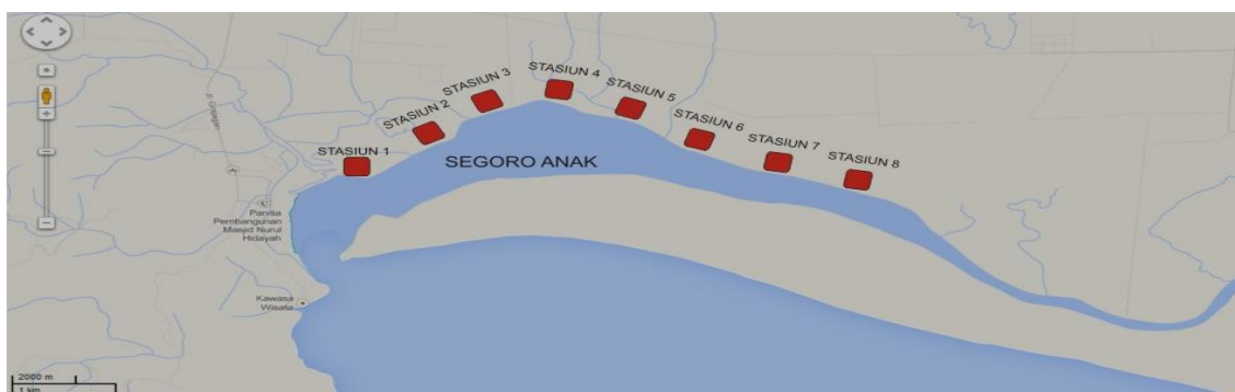
Gambar 5. Tampilan Peta Lokasi Masing-Masing Stasiun dari Stasiun 1–8

Rury (2015) menyatakan bahwa hanya plot-plot yang masih terjangkau oleh mekanisme pasang surut yang terdapat Biota laut khususnya tergenang air, sehingga penggunaan plot ataupun panjang stasiun tidak perlu terlalu masuk ke dalam hutan mangrove, sehingga bisa menghemat waktu, tenaga dan biaya. Maka Stasiun yang dibuat adalah 1 sampai 8 dengan ukuran 100 m x 50 m. Pada setiap stasiun dibuat empat transek dari sumbu utama ke arah dalam hutan mangrove, dengan posisi transek tegak