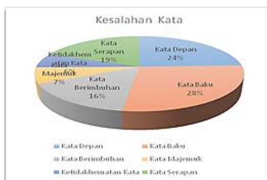
Grafik 3.2 Kesalahan Pilihan Kata

Berdasarkan analisis data dan pembahasan di atas, kesalahan pilihan kata yang terdapat dalam karya ilmiah mahasiswa dan dosen IAIN Tulungagung mencakup: (1) kesalahan penggunaan kata depan sebanyak 28 kesalahan, (2) kesalahan penggunaan kata baku sebanyak 32 kesalahan, (3) kesalahan penggunaan kata berimbuhan sebanyak 18 kesalahan, (4) kesalahan penggunaan kata majemuk sebanyak 8 kesalahan, (5) kesalahan ketidakhematan kata sebanyak 7 kesalahan, dan kesalahan penggunaan kata serapan sebanyak 22 kesalahan. Kesalahan pilihan kata yang terdapat dalam karya ilmiah yang diteliti akan disajikan dalam grafik di bawah ini.