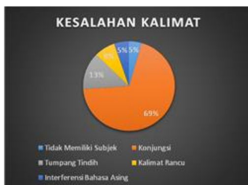
Grafik 3.3 Kesalahan Kalimat

Berdasarkan analisis data dan pembahasan, ditemukan bahwa kesalahan kalimat yang terdapat dalam karya ilmiah mahasiswa dan dosen IAIN Tulungagung meliputi: (1) kesalahan tidak memiliki subjek sebanyak 6 kesalahan, (2) kesalahan penggunaan konjungsi sebanyak 93 kesalahan, (3) kesalahan kalimat yang tumpang tindih sebanyak 18 kesalahan, (4) kesalahan kalimat rancu sebanyak 10 kesalahan, dan (6) kesalahan karena interferensi bahasa Asing sebanyak 7 kesalahan. Kesalahan-kesalahan tersebut disajikan dalam grafik di bawah ini.