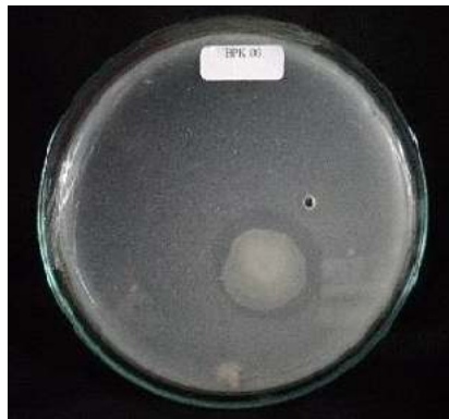
Gambar 1. Bakteri Pelarut Kalium pada Aleksandrov agar

melarutkan kalium baik secara kualitatif maupun secara kuantitatif. Secara kualitatif, kemampuan BPK dalam melarutkan kalium dinilai dari Indeks Pelarutan (IP). Indeks pelarutan merupakan perbandingan antara diameter zona bening dengan diameter koloni BPK. Sehingga semakin tinggi pertumbuhan BPK atau semakin besar BPK maka nilai IP akan semakin kecil. Sebaliknya semakin panjang diameter zona bening yang dihasilkan maka semakin besar nilai IP. Tabel 2 menunjukkan bahwa isola J2-2 memiliki IP paling tinggi (3,99) dibandingkan dengan isolat lainnya, padahal diameter zona beningnya bukan yang terbesar, yakni 3,22. Hal tersebut menunjukkan bahwa diameter koloni BPK isolat J2-2 sangat kecil. Isolat L1-1 memiliki IP yang tergolong kecil yakni 1,06. Disisi lain zona bening dari isolat L1-1 lebih tinggi dibanding J2-2, yakni 5,88. Hasil IP isolat L1-1 menunjukkan bahwa diameter koloni isolat J2-2 lebih besar dibanding koloni isolat L1-1.