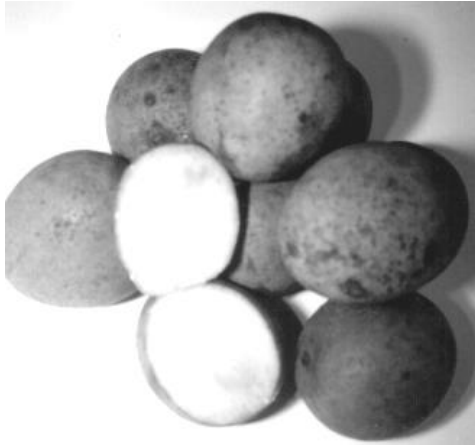
Gambar 3. Putaran