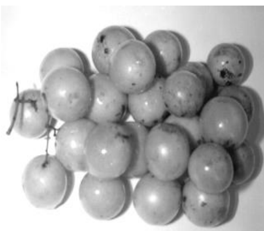
Gambar 2. Ramanian/Gandaria