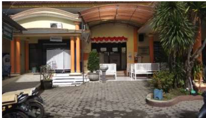
Gambar 3 : Klinik Suherman Jember