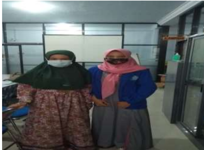
Gambar 2 : Foto bersama karyawan Klinik bagian Umum dan Humas