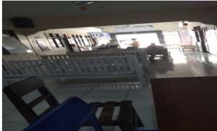
Gambar 5 : Ruang tunggu Klinik Suherman Jember