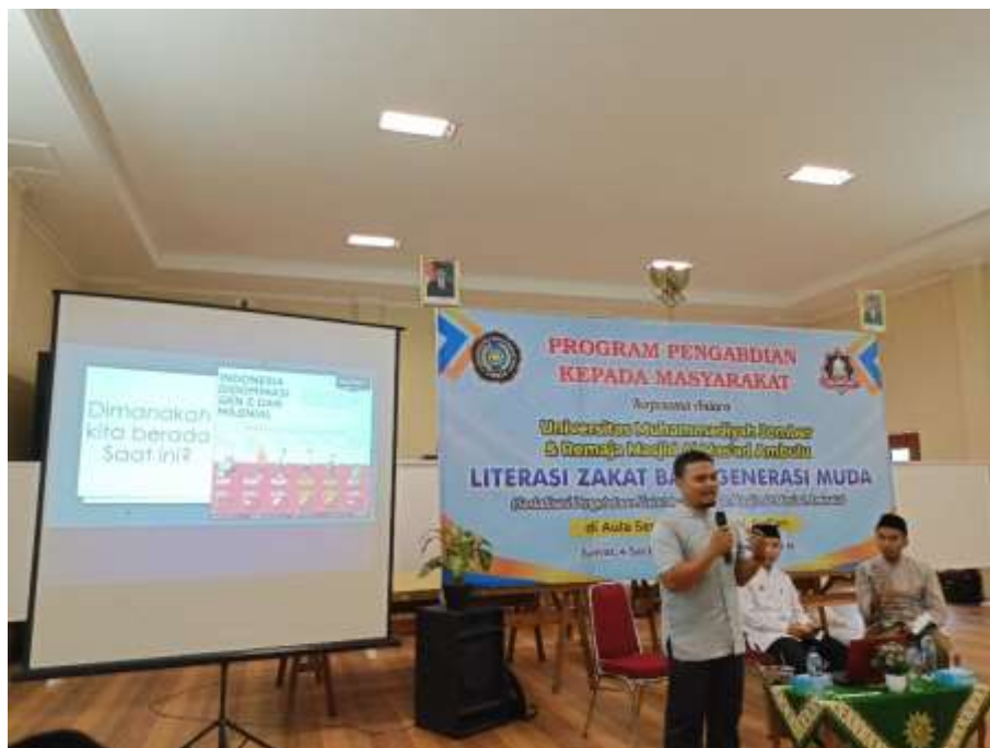
Gambar I; Penyampaian Materi

Materi pelatihan selanjutnya diuraikan tentang pentingnya manajemen pengelolaan zakat yang dilakukan oleh Lembaga atau organisasi seperti remaja masjid. Pada era saat ini, pengelolaan zakat harus dilakukan oleh sebuah Lembaga atau organisasi. Hal ini merujuk pada Undang-undang Nomor 31 Tahun 2011 tentang pengelolaan zakat, yang mensyaratkan adanya Lembaga Zakat untuk mengelola dana zakat. (Pemerintah et al., 2014)