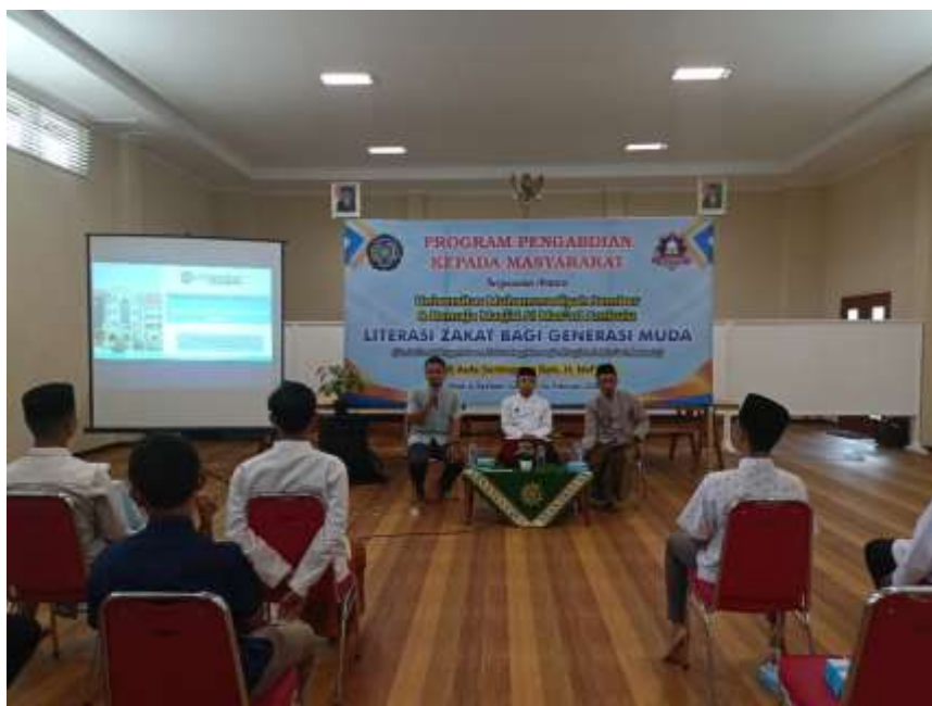
Gambar II; Penyampaian Materi

Materi pelatihan selanjutnya diuraikan tentang pentingnya manajemen pengelolaan zakat yang dilakukan oleh Lembaga atau organisasi seperti remaja masjid. Pada era saat ini, pengelolaan zakat harus dilakukan oleh sebuah Lembaga atau organisasi. Hal ini merujuk pada Undang-undang Nomor 31 Tahun 2011 tentang pengelolaan zakat, yang mensyaratkan adanya Lembaga Zakat untuk mengelola dana zakat. (Pemerintah et al., 2014)