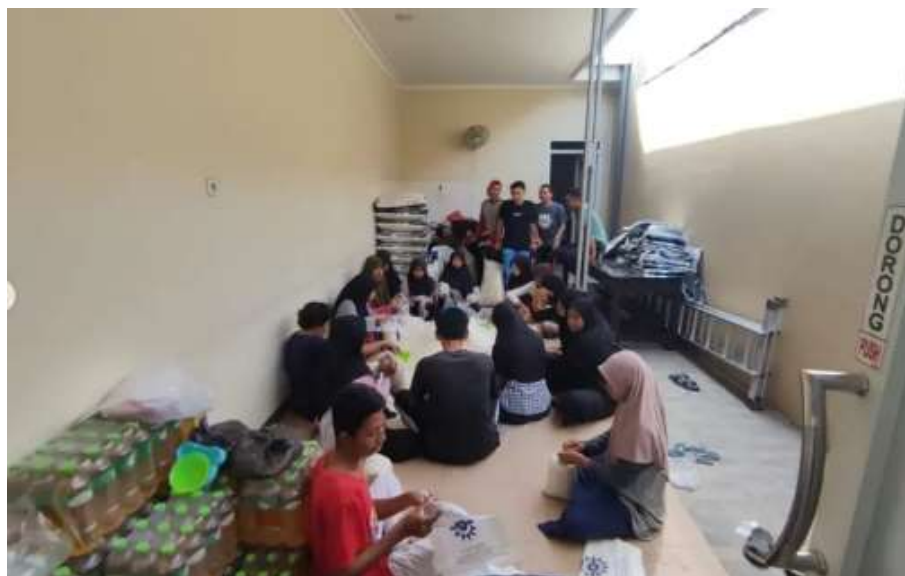
Gambar III; Penyaluran Zakat fitrah sebagai bentuk pendampingan

Adapun bentuk pendampingan yang tim pelaksana lakukan adalah dengan memberikan penugasan agar para remaja Masjid Al-Mas'ad membentuk struktur pengelola zakat. Proses pembentukan inilah yang kami dampingi termasuk di dalamnya melakukan pembagian tugas dari masing-masing divisi. Sampai pada tahapan ini bukan berarti tanpa kendala. Minimnya pemahaman para remaja tentang literasi zakat menjadi salah satu kendala. Namun, hal tersebut dapat diminimalisir setelah pemberian materi pelatihan sebelumnya. Sehingga perumusan struktur Pengelola Zakat bagi remaja Masjid AL-Mas'ad dapat terselesaikan dengan baik.